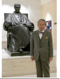
2017年1月10日 最高裁判所内にて

2014年2月20日にロサンジェルス地方連邦裁判所に提訴されたグレンデール市の慰安婦像撤廃訴訟が、丸3年を迎えた。その設置決議の前年7月9日からすると3年半である。その間に、裁判は地方連邦裁判所の勧告も有って、連邦裁判所だけではなく、カリフォルニア州の裁判所でも展開されることになった。しかし、判事は州の裁判所も連邦裁判所でも慰安婦に関して性奴隷説に傾倒しているようで、我々が展開している法律論、即ち、市のような地方自治体は連邦政府に独占権が与えられている外交分野に介入すべきではないとする議論、よりも、組織的な人権侵害をした(とされる)日本軍とそれに関係する人々を制裁するのに熱心で、連邦裁判所でも州の裁判所でも、第一審、第二審ともに敗訴することになったことは、前にお知らせしたとおりである。 連邦の控訴裁判所からは、2016年8月4日に控訴状の却下が告げられた。それに対して、9月16日に控訴裁判所の全員参加による再審査を請求したのであるが、10月13日にそれも却下された。