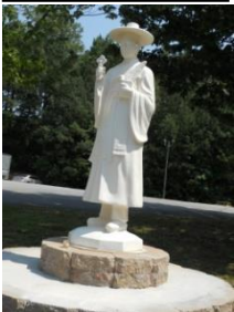
韓国教会の韓流ヨセフ・マリア像

今回は阻止できましたが、数年間かけて計画を練ってきた韓国系団体は振り上げた拳を下ろしていません。まだまだ安心はできないのが現実です。