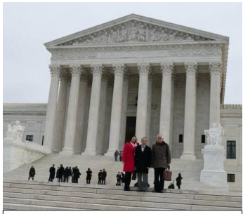
同1月10日最高裁判所前にて

これらの過程を通して我々が行ったことは、日本政府からの文書の提出であった。「関係者からの通知(Letter of Interest)」であるとか「第三者意見書(Amicus Curiae)」という形で、政府は、日本の立場を明確に裁判所に伝達することが出来るのである。実際に、いくつかの国の政府はそのようなことをしているのである。特に、トルコから大虐殺をされたといわれるアルメニア人たちは、米国で、それを理由に、トルコを糾弾することを試みたが、トルコ政府は、トルコ人の名誉を保つために、裁判所に意見書を送り、「トルコによるアルメニア人の大虐殺」が定説にならないように、努力をして、成功しているのである。しかし、日本政府は、それまでは断固として、そのような助力を断ってきました。